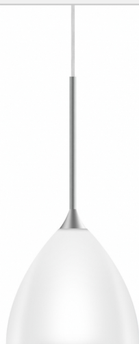
SILVA / 160 G9 S